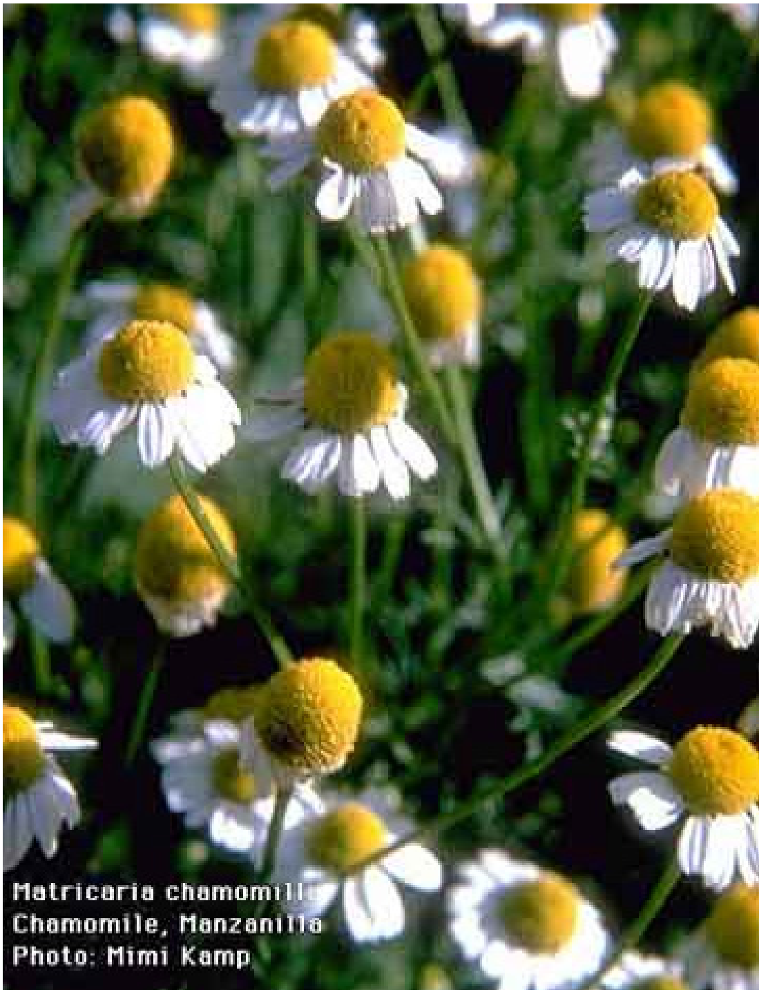
Matricaria chamomilla Chamomile, Manzanilla